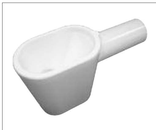
Рис. 1. Капельная воронка HL 21

Для справки: в Европе и Америке дренаж от систем кондиционирования подключается к бытовой канализации без «разрыва струи» только через гидрозатвор. Все санитарно-технические