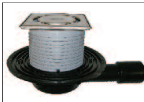
Рис. 5. Трап с «сухим» сифоном HL90Pr

Например, в инструкции по монтажу американской бытовой установки (5-ступенчатого фильтра) по очистке воды с обратным осмосом «Атолл» показано подключение дренажной трубки посредством специального хомута к патрубку сифона кухонной мойки. Далее приведена фотография разобранного сифона после года эксплуатации данного фильтра. Необходимо упомянуть, что сброс дренажа в канализацию был нами выполнен с «разрывом струи» через капельную воронку HL 20. Думаю, достаточно