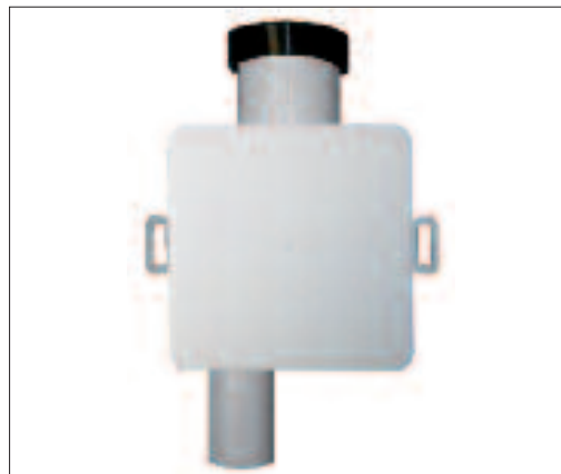
Рис. 4. Сифон для кондиционеров HL138 скрытого монтажа

приборы оборудуются гидрозатвором для предотвращения попадания загрязненного воздуха из канализационных трубопроводов в помещения, где могут находиться люди. А любой гидрозатвор можно представить в виде U-образной трубки. Одна ветвь гидрозатвора всегда каким-либо образом присоединяется к канализационным трубопроводам, другая ветвь гидрозатвора всегда сообщается с атмосферой. Поэтому вода из гидрозатвора свободно испаряется. Если прибором не пользоваться, т. е. не сливать в него воду, то в течение 20–30 дней вода из гидрозатвора испаряется и загрязненный воздух беспрепятственно попадает в систему кондиционирования здания.