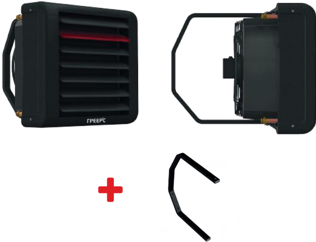
КОНСОЛЬ В КОМПЛЕКТЕ

Предназначены для отопления общественных, торговых и промышленных объектов.